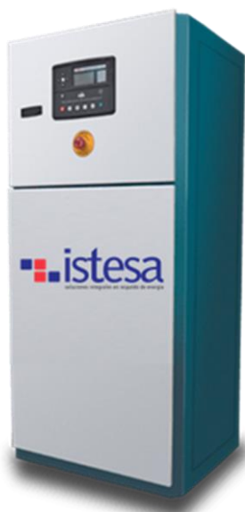
TABLERO DE CONTROL Y TRANSFERENCIA MCA GP TIPO AUTOSOPORTADO MODELO GP- C

El tablero de transferencia automático modelo GP-300 (220V) formado por interruptores termomagnéticos de 1000 Amp. tiene la función de arrancar, parar, proteger tanto el motor diesel como el generador eléctrico y hacer la transferencia y retransferencia de la carga de la red de CFE a la planta y viceversa por medio del módulo de control DSE-7320. Todo esto de forma automática o manual.